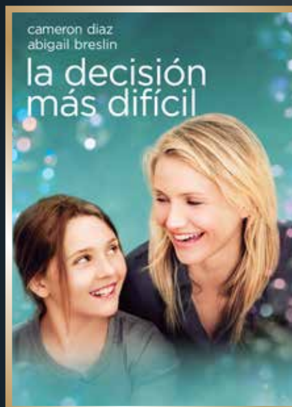
Septiembre & Respeto