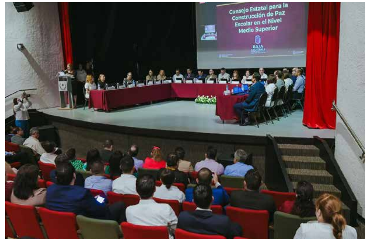
Se reúnen autoridades educativas en un esfuerzo por promover la paz y la educación para las y los jóvenes de BC.

A lo largo de dicha actividad se revisaron las acciones para identificar, atender y prevenir el ciberbullying, violencia de género, y adicciones, así como cualquier otra situación que ponga en riesgo el acceso de la comunidad estudiantil a una educación pacífica y plena.