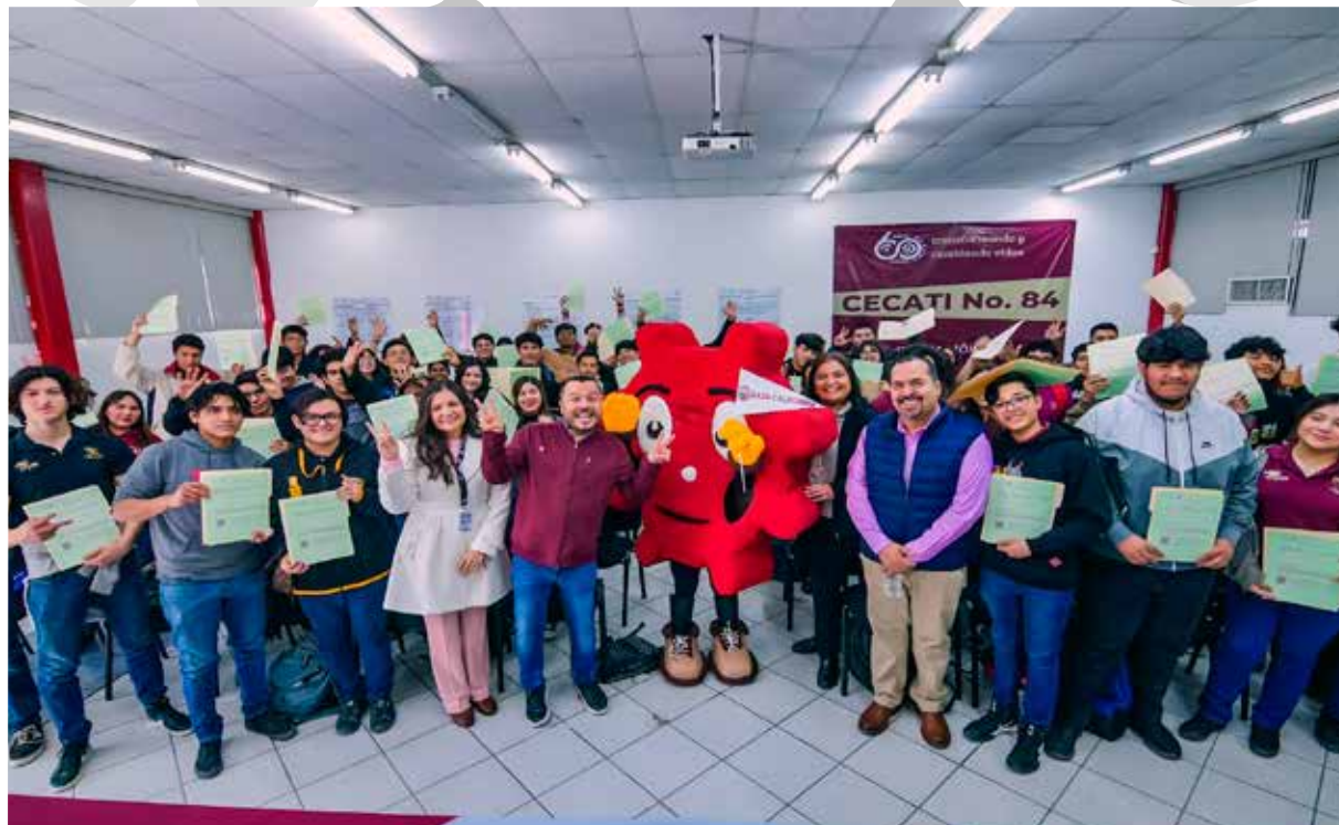
Los nuevos lince participaron en una tarde llena de juegos y aprendizaje en compañía de los elementos de la SSPCM.

Este programa tiene como objetivo brindar a las y los estudiantes de todo el Estado, información preventiva que les puede ser útil ante una situación de riesgo.