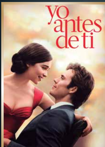
Diciembre & Tolerancia