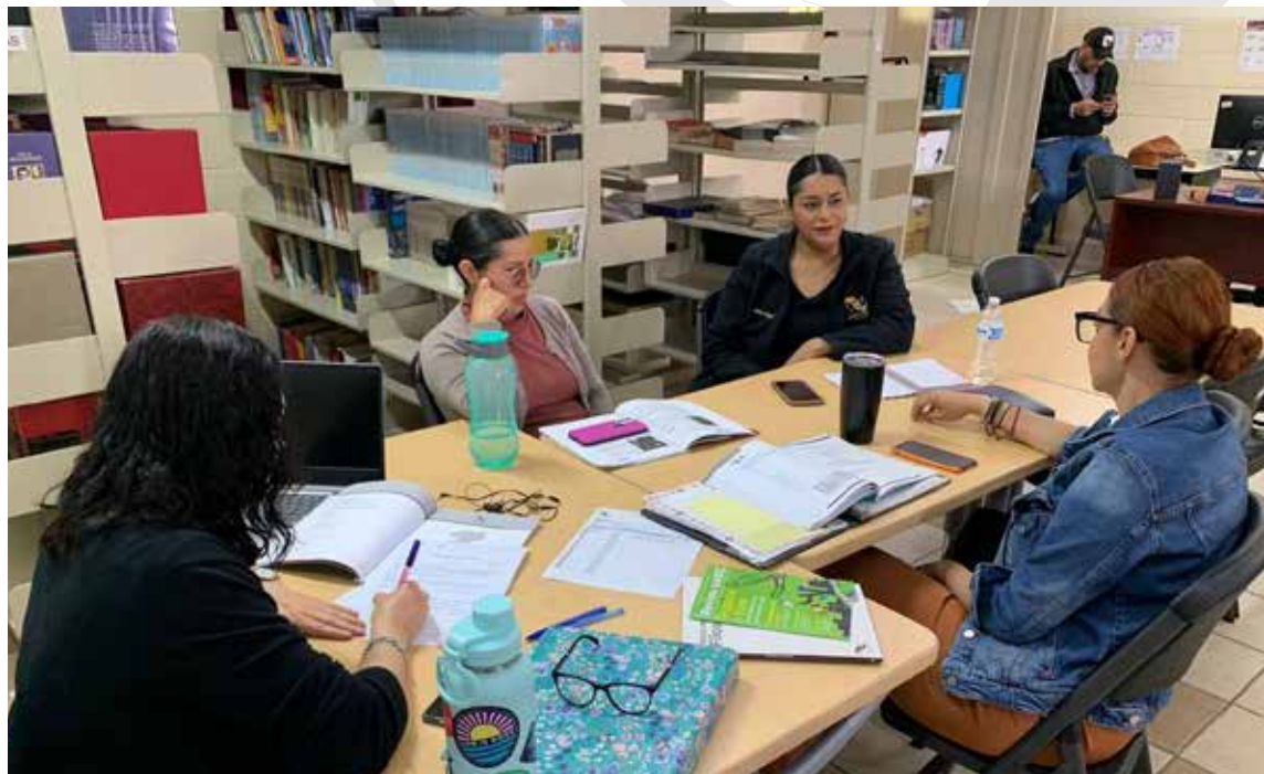
Directivos y docentes analizan estrategias encaminadas a fortalecer el plan educativo.

El objetivo de esta actividad es desarrollar un sentido de pertenencia en los jóvenes a través de diversas actividades artísticas que los impulsen a trabajar en equipo para superar las pruebas que se les presenten.