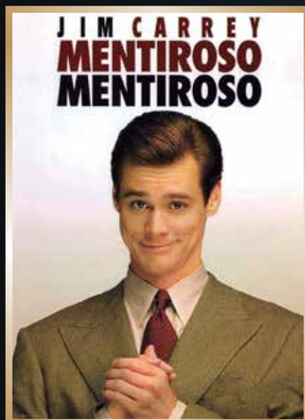
Agosto & Honestidad