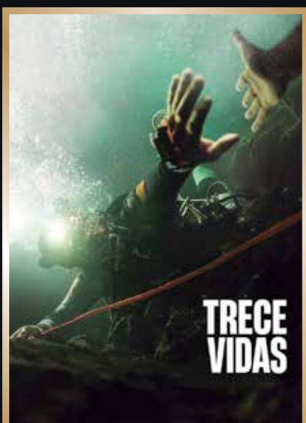
Octubre & Solidaridad