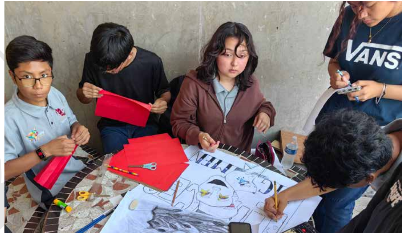
Las y los estudiantes de nuevo ingreso participaron en diferentes actividades artísticas como pintura, teatro y danza, entre otras.

Esta tarea es clave en el ejercicio académico, ya que permite evaluar la efectividad de los planes anteriores y actualizarlos, lo que asegura la calidad del proceso de enseñanza-aprendizaje para el bachillerato tecnológico, beneficiando principalmente el aprendizaje de los jóvenes lince.