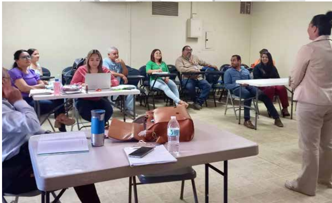
Este programa de actualización en protocolos de Seguridad Escolar continuará en 2024-2 para el resto del Estado.

Esta jornada de actualización también se llevó a cabo para el personal de los planteles de Ensenada y Rosarito, por lo que para el semestre 2024-2 se tiene programado completar la actividad en Mexicali, Tijuana, Tecate y San Quintín.