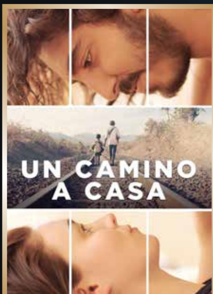
Noviembre & Identidad