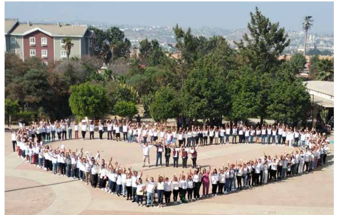
Más de 3 mil asistentes en todo el Estado durante esta primera jornada de capacitación.

Cabe mencionar que, durante el mes de octubre habrá una segunda ronda para completar el ciclo de participación por parte de los familiares y tutores legales de los jóvenes de todo el Estado.