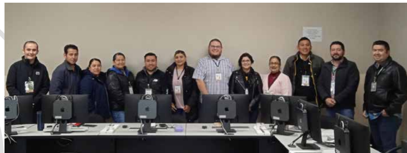
Una decena de docentes de la carrera de Programación recibirán una capacitación por personal de la UABC para desarrollar aplicaciones móviles.