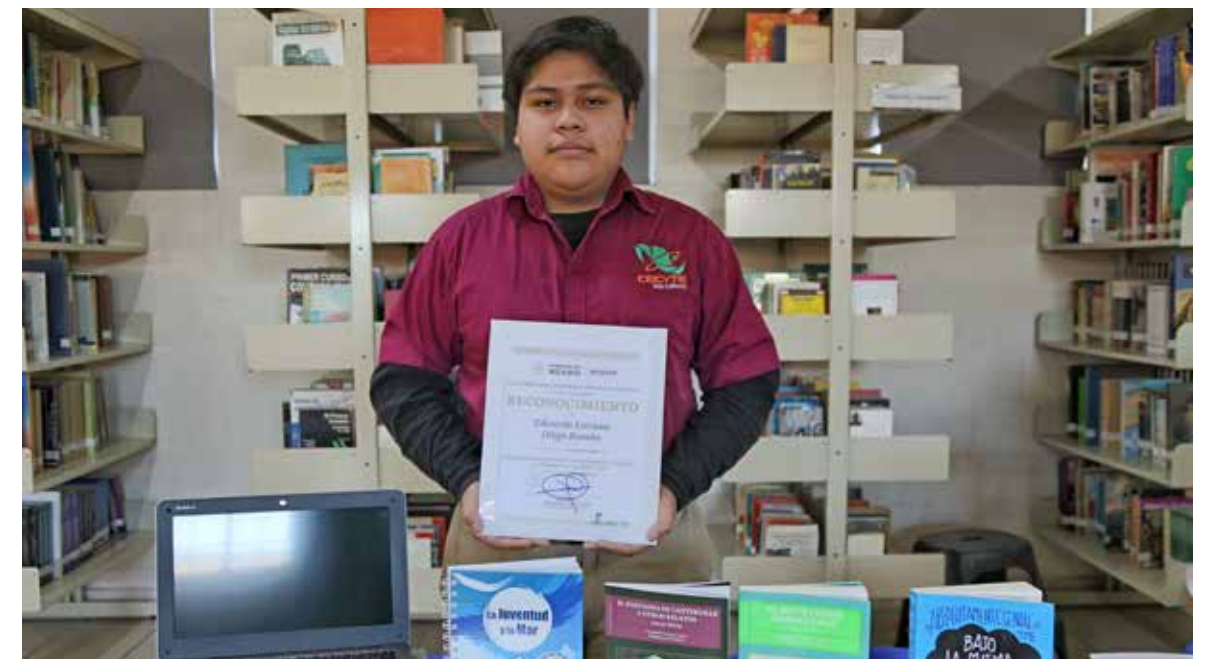
Para ganar el segundo lugar, el joven presentó el trabajo: "El barco de la muerte", un cuento corto que navega entre los géneros de suspenso y terror psicológico.

Al respecto, el orgulloso ganador, nos compartió que "Estoy muy feliz de haber participado, la verdad no esperaba ganar y un día sin esperarlo me llegó esta noticia y todos en casa nos emocionamos. Quiero decirle a mis compañeros que no tengan miedo de participar y que confíen en ustedes mismos".