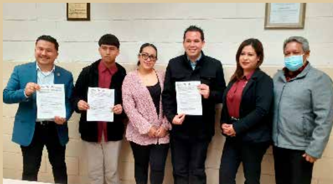
Gracias a esta oportunidad, las y los estudiantes del plantel Rosarito del Colegio contarán con más opciones para su desarrollo profesional.

En ese sentido, el director del plantel Rosarito señaló que las y los estudiantes interesados en integrarse al programa dual pueden acercarse al área de Servicios Educativos del plantel para informarse acerca de los requisitos y bases de esta convocatoria.