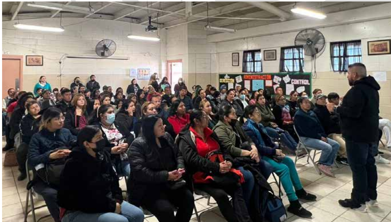
Con una participación de más de 200 padres, madres y tutores de familia se realizó la primera reunión académica del ciclo escolar.

Esto, con el fin de establecer una línea de comunicación y de unificación de esfuerzos con los responsables de las y los estudiantes.