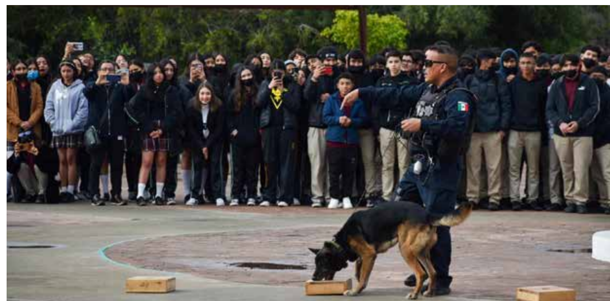
Hasta el momento se han visitado a los planteles Cachanilla, Zona Río y El Florido, sin embargo se tiene planeado continuar con estos acercamientos en el resto de los planteles.

Durante dichos recorridos, se participó en las ceremonias de los honores a la bandera dentro de las instalaciones educativas donde se aprovechó para hacer una demostración de la unidad canina K9; asimismo, se les impartieron pláticas informativas acerca de la prevención de drogas y adicciones, y de violencia en el noviazgo, al final también se realizó un operativo mochila.