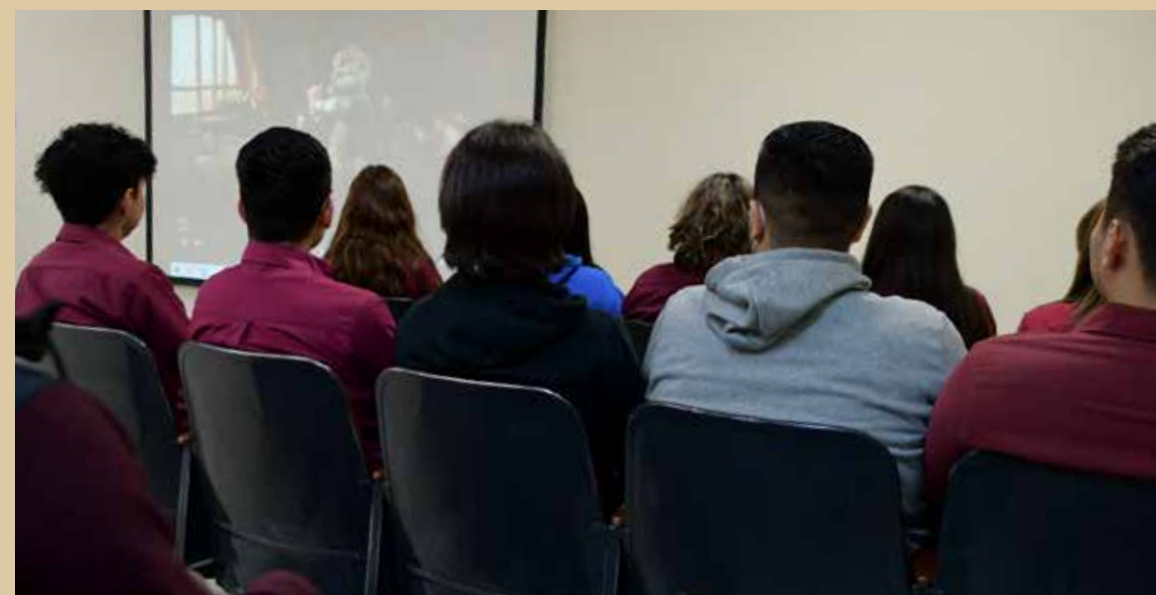
Durante este ciclo, se proyectarán las películas de Pinocho, Talentos ocultos, Whiplash, Extraordinario y Campeones.

Cada semestre, se presenta una nueva cartelera, misma que se busca sea atractiva para la comunidad estudiantil, por lo que también se aceptan sugerencias.