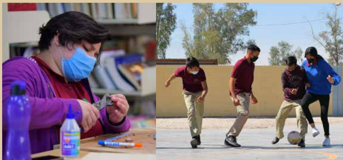
Danza, ajedrez, literatura, básquetbol, fútbol y voleibol son parte de las actividades que los alumnos pueden desempeñar.

Además, Dunn Fitch explicó que hasta el momento se han logrado destinar 843 horas para este programa con el cual además de cumplir con las asignaturas del plan académico, las y los alumnos de primer y segundo semestre tienen asignadas materias cocurriculares para elegir entre actividades artísticas o deportivas; a las que también pueden sumarse alumnos de todos los semestres si así lo desean.