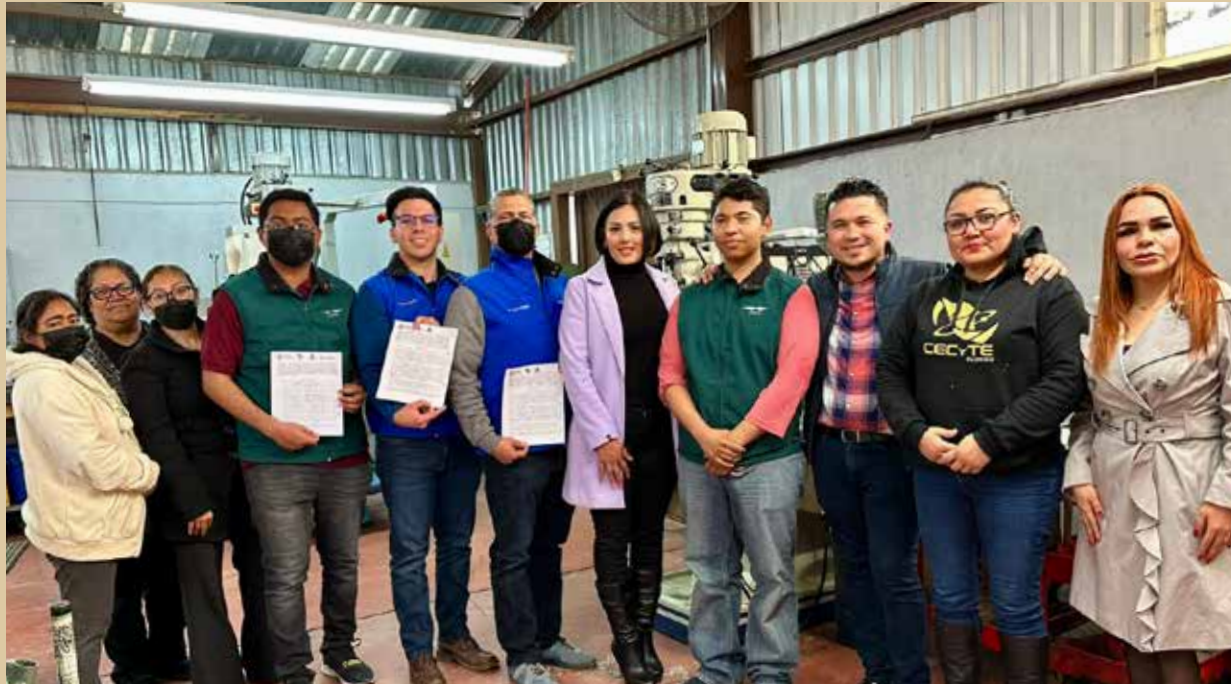
El Colegio y las empresas Jeques MX e Insol firmaron un convenio de colaboración para incorporarse al Programa Dual Empresarial.