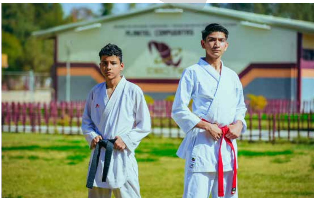
Dos jóvenes talentosos del plantel Compuertas arrasaron en la categoría juvenil de esta competencia con el 2do. y 3er. lugar.

Cabe mencionar que, ambos jóvenes talentosos continúan en preparación para representar a Baja California el próximo 24 a 26 de marzo en los Juegos Macroregionales de la Conade 2023 que tendrán lugar en La Paz, Baja California Sur.