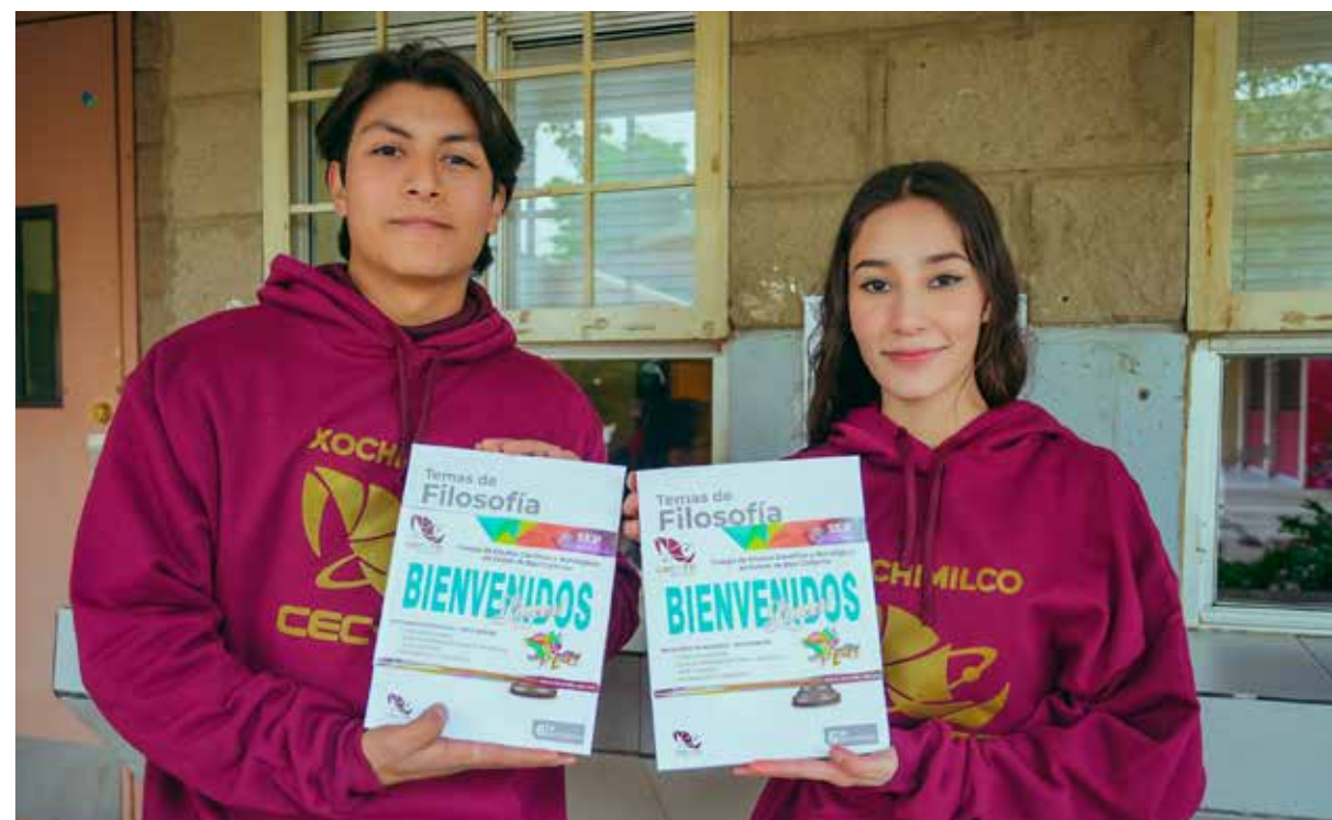
Las guías de aprendizaje ya se encuentran disponibles en los planteles y grupos del Colegio.

Para adquirir las guías, el estudiante debe ingresar al sitio Herramientas para Alumnos con la liga www.cecycetbc.edu.mx/HA/ , donde tendrá la opción de solicitar los ejemplares de las asignaturas del semestre, dependiendo de su grado, y posteriormente, recogerlas en el plantel.