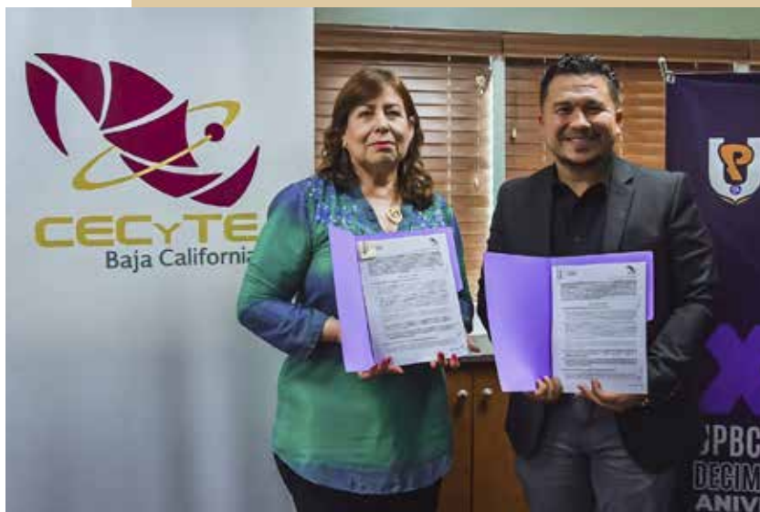
Gracias a estas alianzas, las y los alumnos tienen más opciones para realizar su servicio social, prácticas profesionales y visitas guiadas, entre otras actividades.