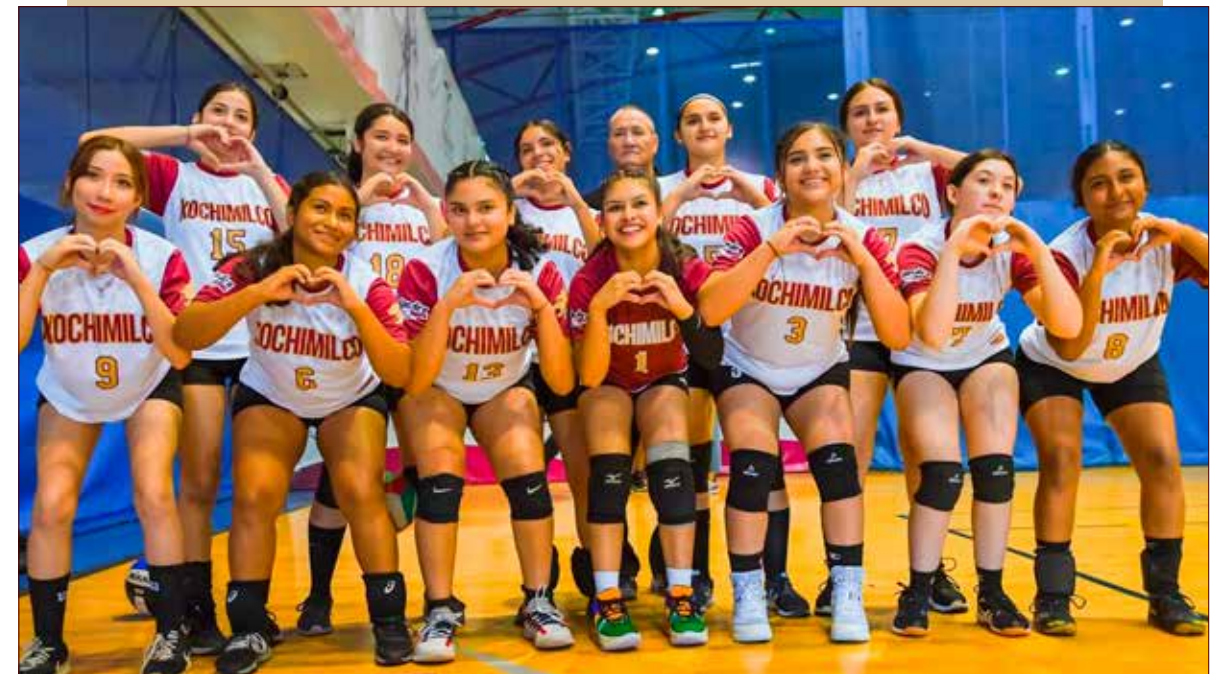
Los equipos ganadores de este encuentro visitarán Chiapas para representar al Estado en el Encuentro Nacional Deportivo InterCECyTEs 2023.

En cuanto a voleibol varonil, consiguieron el primer puesto los lince de Tijuana, en segundo Mexicali y tercero Rosarito; en voleibol femenino ganó Mexicali y Tijuana; en básquetbol femenino: Ensenada, Rosarito y Tijuana; y en básquetbol varonil triunfaron los equipos de Tijuana, Mexicali y San Quintín, respectivamente.