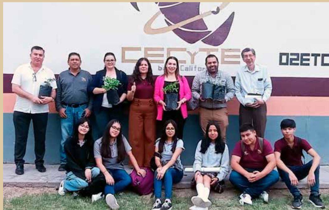
A través de los programas de tutorías, asesorías, orientación y el apoyo de prefectura se garantizan las vías para que las y los alumnos alcancen la excelencia escolar.

Cabe mencionar que son alrededor de 6 mil estudiantes del Colegio quienes en semestres anteriores han sido capacitados.