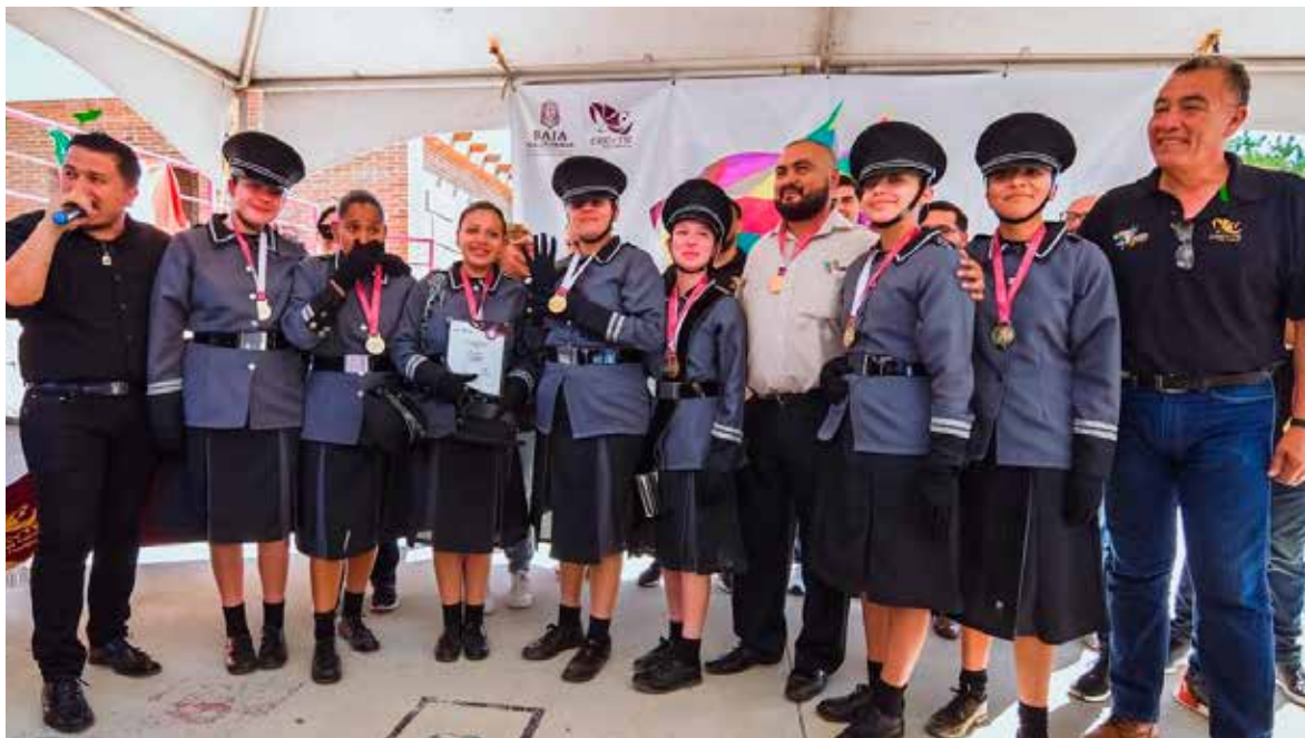
Alrededor de 350 estudiantes de los municipios de Mexicali, Tijuana, Tecate, Ensenada, Rosarito y San Quintín se enfrentaron en esta competencia.

Los ganadores de este concurso -así como los ganadores del Festival Estatal de Arte y Cultura del CECyTE BC- representarán a Baja California en el Festival Nacional de Arte y Cultura de los CECyTEs 2023, que se realizará del 20 al 22 de septiembre en Aguascalientes.