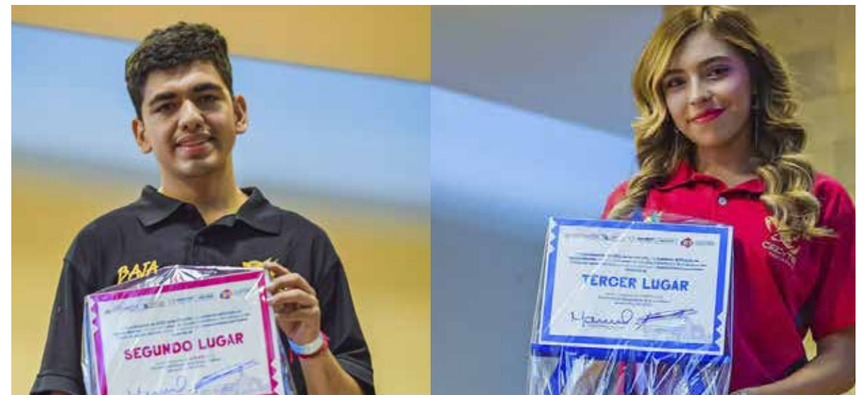
Del 20 al 22 de septiembre, una delegación de 51 estudiantes representaron orgullosamente a Baja California en este encuentro artístico.

Asimismo, contamos con la valiosa representación de 48 estudiantes en las disciplinas de danza folklórica, pintura, oratoria, cuento corto, banda de guerra, poesía, declamación, escultura y fotografía.